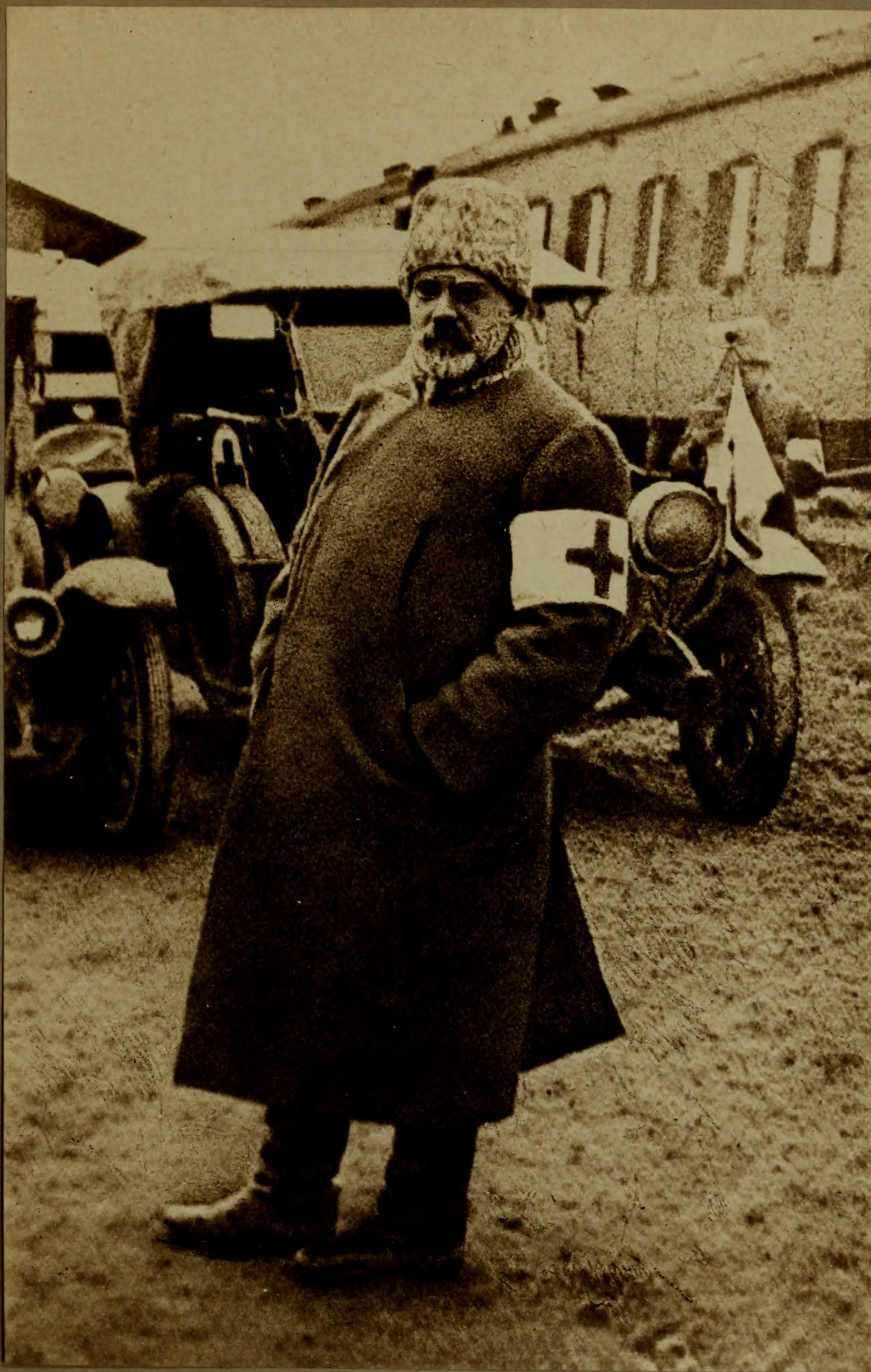
АЛЕКСАНДРЪ ИВАНОВИЧЪ ГУЧКОВЪ Главный уполномоченный Краснаго креста.